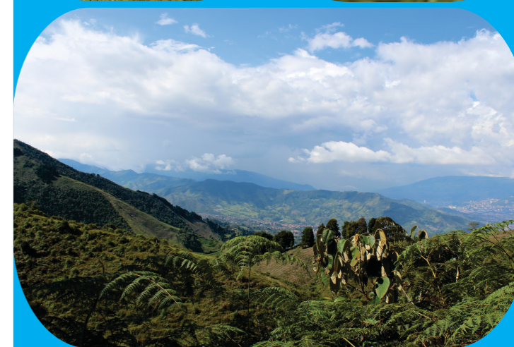
Plegable Coleccionable N° 2